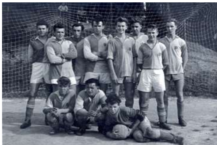
Rok 1960 - fotbalové mužstvo před zápasem.